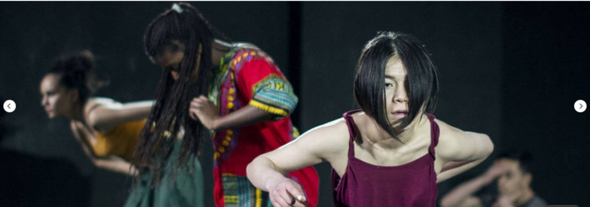
Jugendliche spielen und tanzen "My Body in Me" im Dschungel Wien